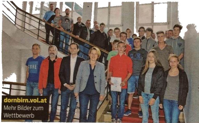
dornbirn.vol.at Mehr Bilder zum Wettbewerb

Gruppenfoto mit den Teilnehmern am Bundeswettbewerb 2016 Fachbereich Bau sowie den Organisatoren der PTS Dornbirn.