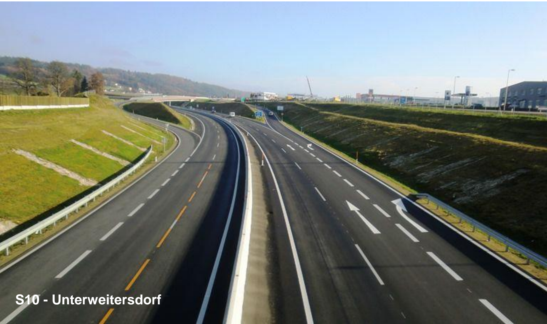
S10 - Unterweikersdorf