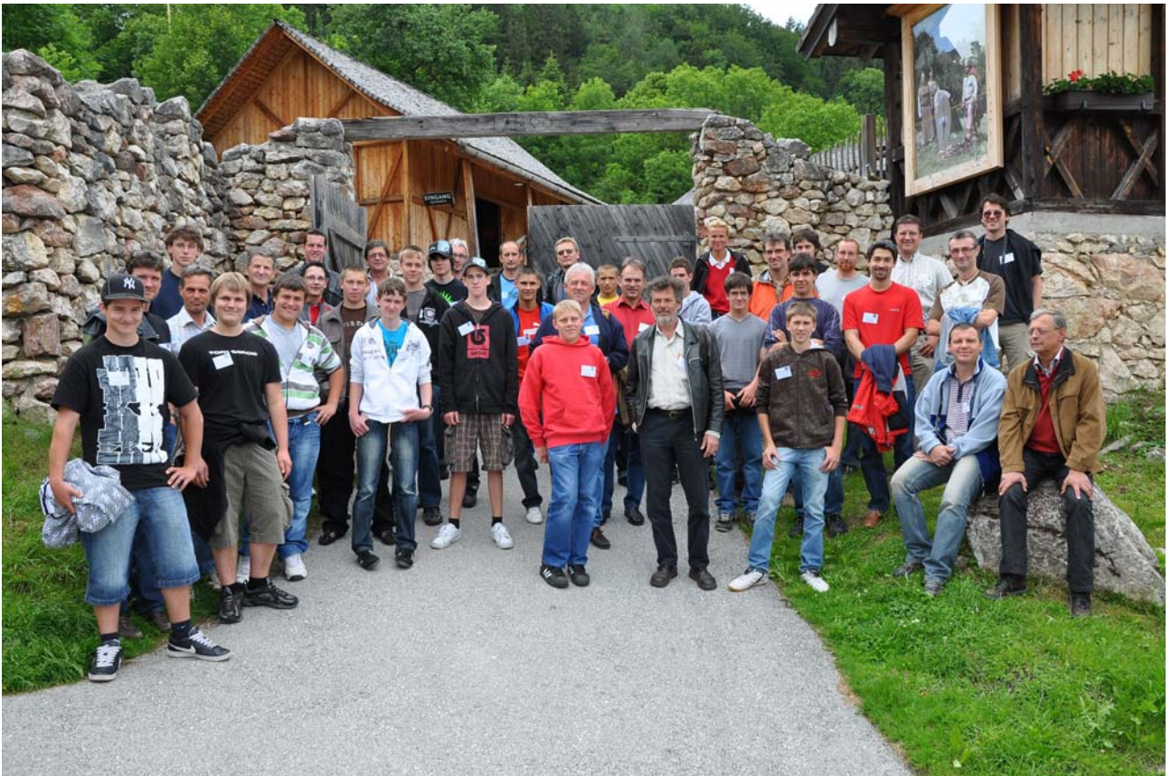
Bild 2 - Alle Teilnehmer