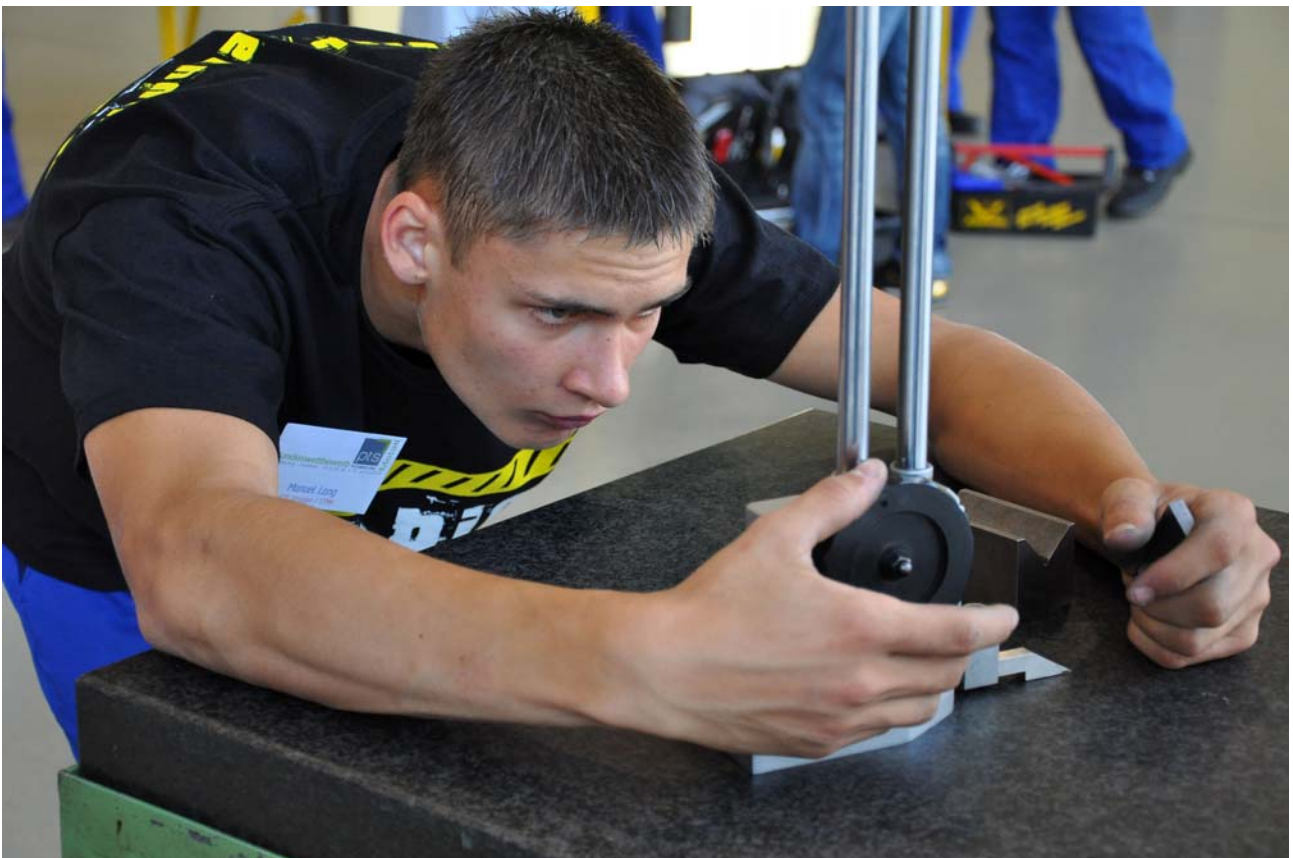
Bild 5 - Genauigkeit ist Alles