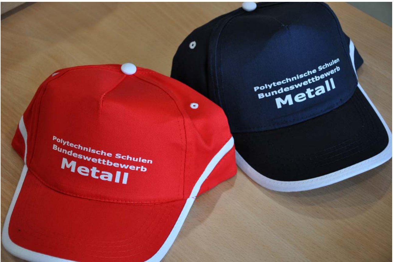
Bild 6 - Werbung für den Fachbereich