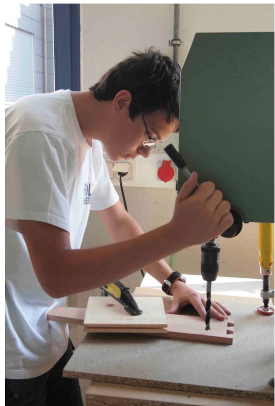
Bohren mit höchster Konzentration