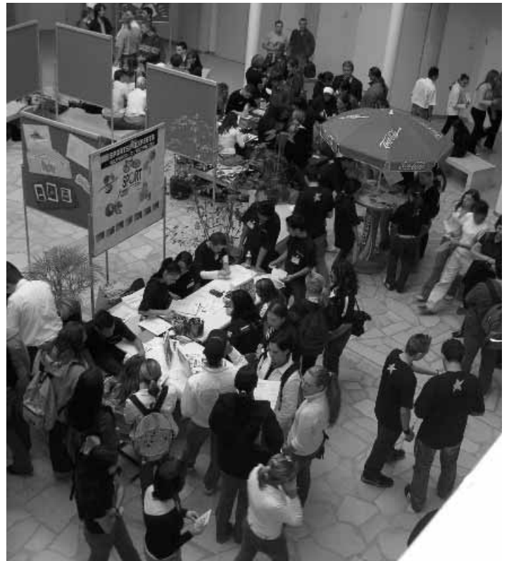
Übungsbetriebe-Messe Wien Juni 2005: Sicht auf die Aula der PTS 3

Im kommenden Schuljahr soll voraussichtlich wieder eine ÜBe-Messe in Wien stattfinden, zu der wir auch Teilnehmer aus anderen Bundesländern herzlich einladen dürfen. Bericht: Christine Winter