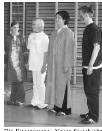
Die Siegergruppe „Neues Sprachrohr“ aus der PTS St. Veit/Glan