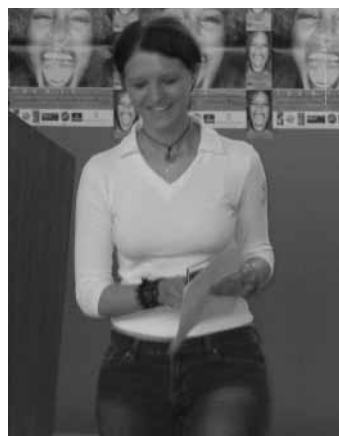
Die Siegerin „Klassische Rede“ aus der PTS Althofen