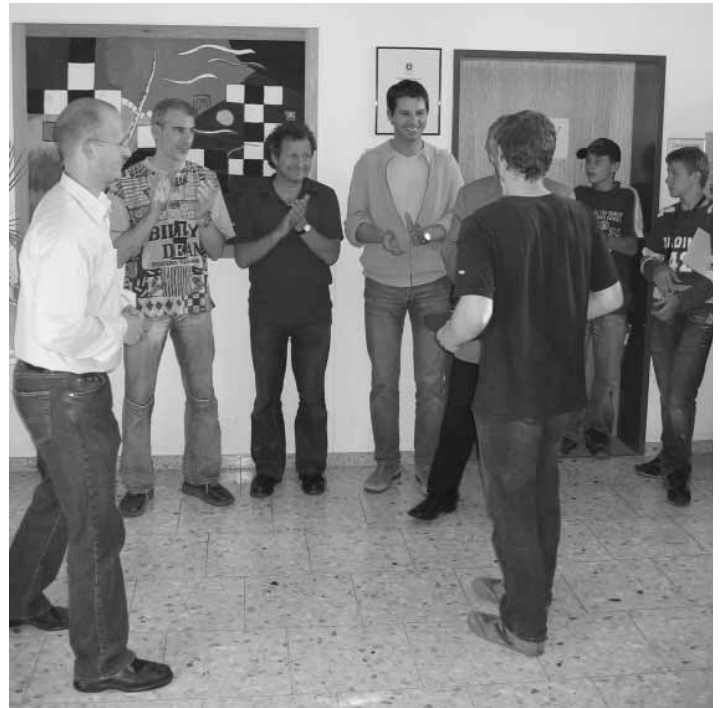
Preisverleihung durch die Tischlermeister und den Bezirksschulinspektor

Damit möglichst viele dieser „Lehr-Start-Profis“ kommen, wurden sie schriftlich zum Fachbereichsklassentreffen mit Diashow