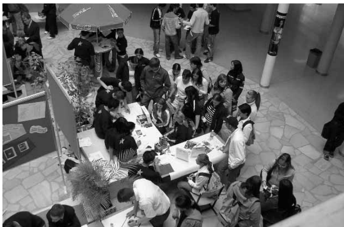
ÜBe-Messe: "Sport-time" ÜBe der PTS 15; Foto Christine Winter 2005