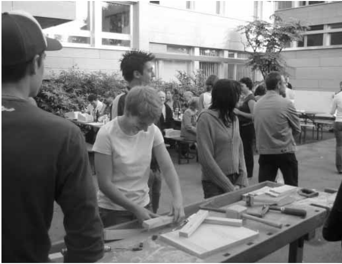
Ehemalige verfolgen mit Interesse den Holztriathlon

Ehemaligen respektable vierzehn zur Grillparty, um in Erinnerungen an ihre eigene Polyzeit zu schwelgen und den Greenhorns gute Tipps zu geben. Zudem haben sie es genossen, anhand der Werkstücke über die Qualität der heurigen Hölzler zu fachsimpeln. Für mich und auch für die heurigen Schüler/-innen war es außerdem sehr interessant zu erfahren, wie die ehemaligen Schüler/-innen ihre Firmen sehen, womit sie zufrieden und worüber sie nicht glücklich sind. Von diesen Gesprächen haben alle Beteiligten profitiert: Die Ehemaligen genossen die Wertschätzung ihrer Schule und die Heurigen konnten von Erfahrungen anderer lernen.