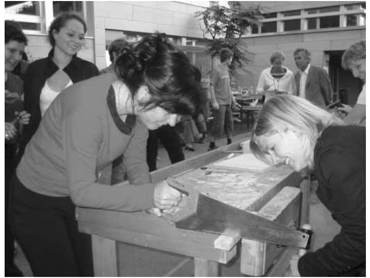
Gute Zusammenarbeit der Lehrer/-innen – vor allem während des Schuljahres