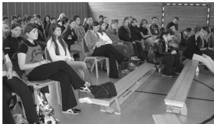
Die interessierten Zuhörer

Der Jugend-Redewettbewerb ist in diesem Sinne seit vielen Jahren ein interessantes Forum für junge Rednertalente.