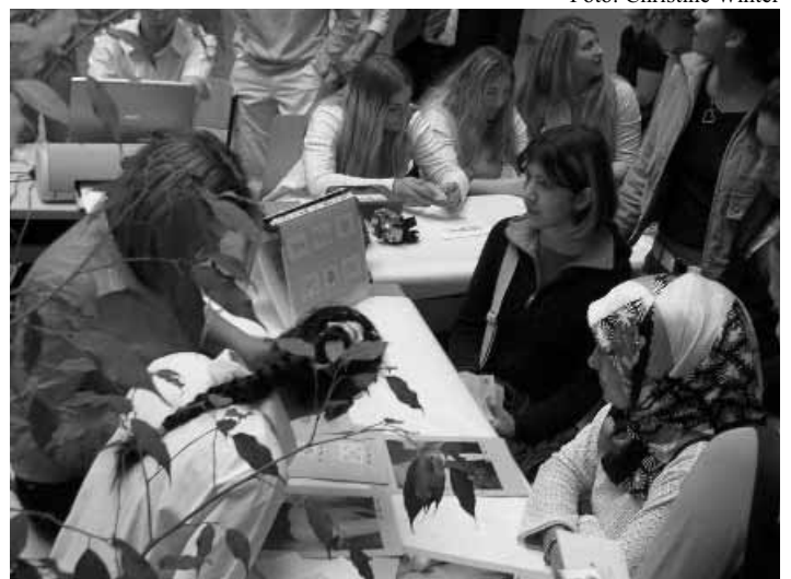
Übungsbetriebe-Messe: Teilnehmer beim Kundengespräch; Foto: Christine Winter 2005