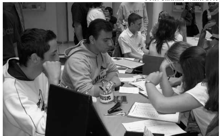
ÜBe-Messe: "Get Mistic" ÜBe der PTS 23