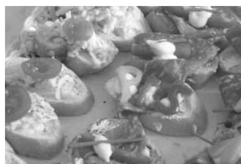
Liebevoll zubereitet von der Tourismusgruppe der PTS Innsbruck: PTS-Brötchen