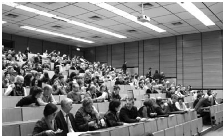
Die Tiroler Lehrerschaft der PTS versammelte sich zum „1. Tiroler Bildungstag der PTS“. In der ersten Reihe alle Bezirksschulinspektorinnen und Bezirksschulinspektoren Tirols.

Bericht: Mag. Brigitte Steiner, Reinhard Strobl