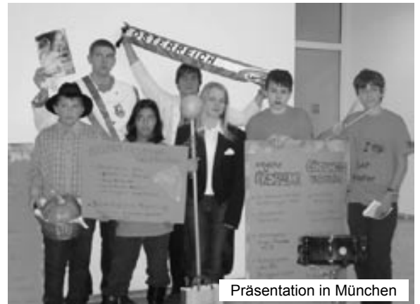
Präsentation in München

Bericht und Fotos: DPTS Johann Wallner, PTS Wildon