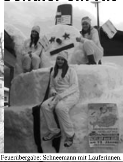
Nach der Feuerübergabe: Schneemann mit Läuferinnen.