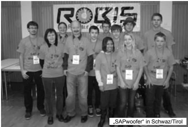
„SAPwoofer“ in Schwaz/Tirol

Aufstieg des Teams der HS- und PTS Wildon beim Legoleague Regionalentscheid zum Europahalbfinale in München