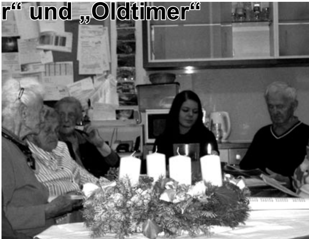
Harmonische Stimmung beim gemeinsamen Singen im Seniorinnen- und Seniorenheim