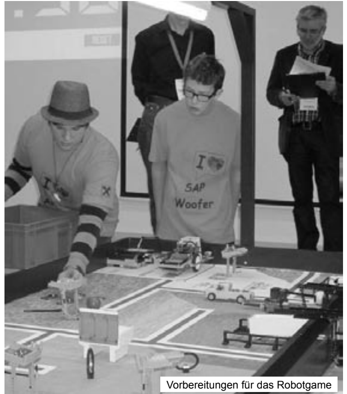
Vorbereitungen für das Robotgame

Dies bedeutete zur großen Freude aller Beteiligten die Qualifizierung für das Europahalbfinale in München. Auch hier konnten sich die „SAPwoofer“ im Robotgame im guten Mittelfeld platzieren und für Steirisches Kürbiskernöl in Deutschland werben, wozu dem Team nur gratuliert werden kann!