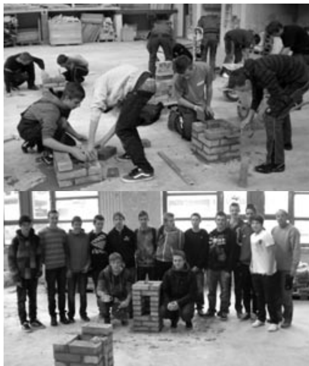
Bericht und Fotos: PTS Birkfeld

Wieder einmal hat sich gezeigt, dass die Zusammenarbeit zwischen der PTS Birkfeld und der Wirtschaft sehr gut funktioniert, ein Umstand, der vor allem den künftigen Lehrlingen zugute kommt.