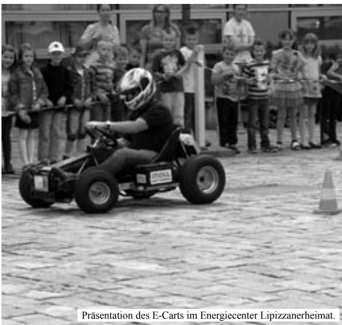
Präsentation des E-Carts im Energiecenter Lipizzanerheimat.