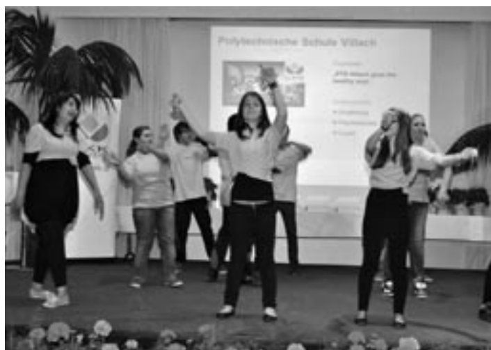
Schülerinnen und Schüler der PTS Villach bei ihrer Tanzaufführung