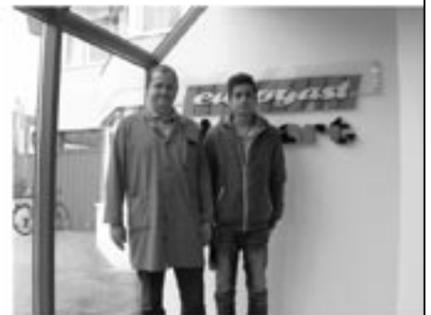
Herr Peer von der Hans Riedhart GmbH mit seinem Poly-Praktikanten

Die praktische Arbeit in „ihren Firmen“ machte den PTFS-PraktikantenInnen sichtlich Spass, aber auch die Partnerbetriebe waren von den Leistungen der neuen „Mitarbeiter“ durchaus überzeugt. (pw)