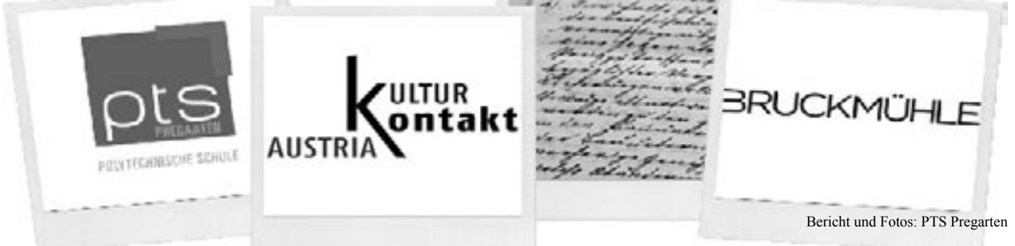
Bericht und Fotos: PTS Pregarten

Bei einem gemeinsamen Fest mit Schülern/innen, Eltern, Gemeindevertretern und Zeitzeugen im Kulturhaus Bruckmühle wurden die Ergebnisse des diesjährigen Projektes präsentiert.