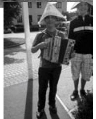
Bericht und Fotos: PTS Pregarten