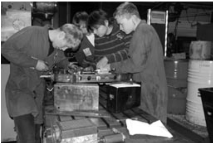
Schüler der PTS Köflach bauen in der Fa. Krenhof das Fahrgestell