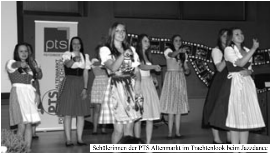
Schülerinnen der PTS Altenmarkt im Trachtenlook beim Jazzdance