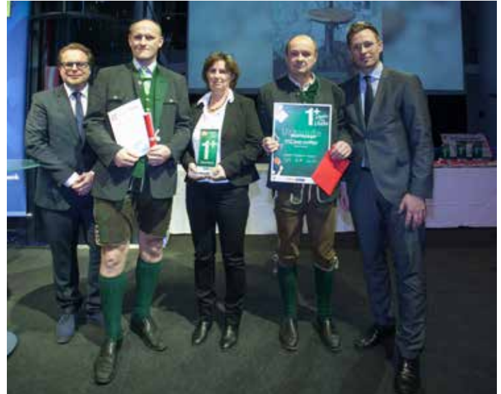
Text und Foto: NMS/PTS Bad Goisern Mitglied von POLYaktiv

Die Lehrerinnen und Lehrer der PTS sind natürlich sehr stolz auf diesen Sieg, der für sie wiederum ein Beweis dafür ist, dass sich die Mühe gelohnt hat.