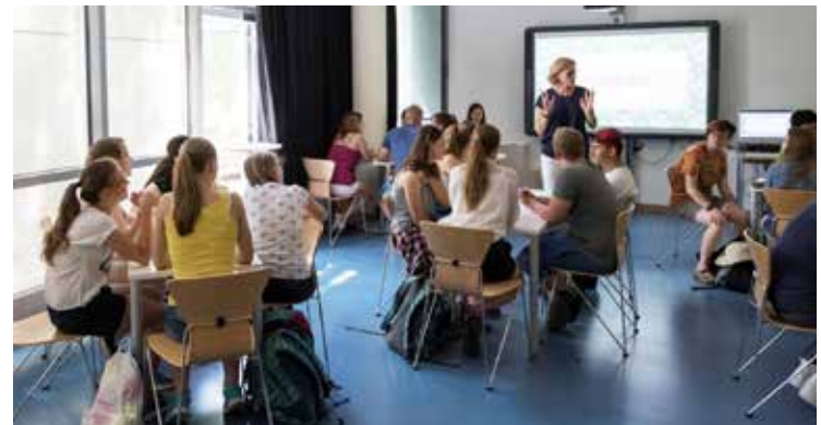
Besuch der Znoimr Klasse in der PTS 20 – Schüler beim Klassenquiz