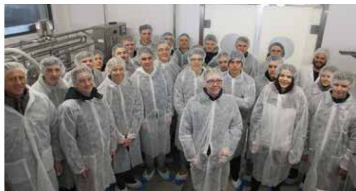
Hygiene wird auch in der Käserei der „Milchbuben“ großgeschrieben