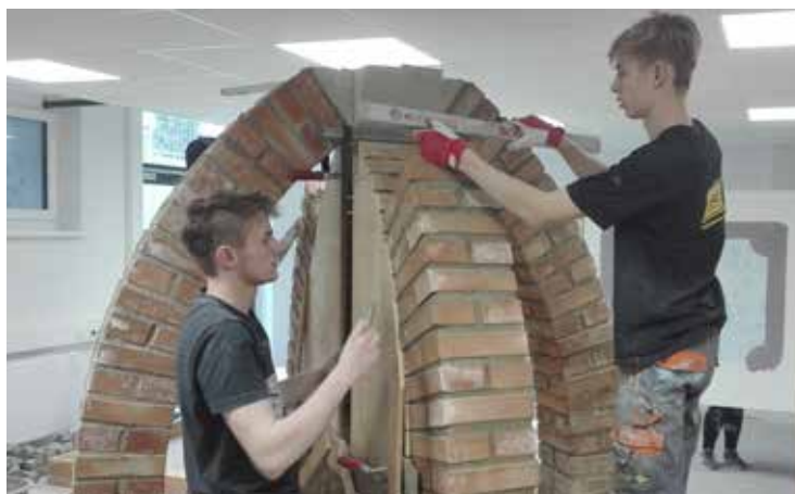
Text und Foto: Mag. Bernhard Beier, PTS Althofen Mitglied von POLYaktiv

Im Anschluss an das Bogenprojekt stand das Pflastern. In der Übungs-Verlegewanne von 2 x 2m gelang den Schülerinnen und Schülern ein ansehnliches Kopfsteinpflaster mit Bordüren und Viertelkreisbögen.