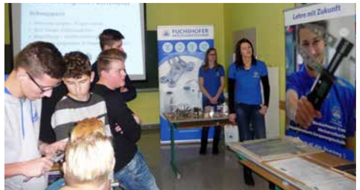
Text und Foto: PTS Deutschlandsberg Mitglied von POLYaktiv

„Es gibt keine zweite Chance einen ersten Eindruck zu machen!“ Mit diesem Rüstzeug sicher kein Problem!