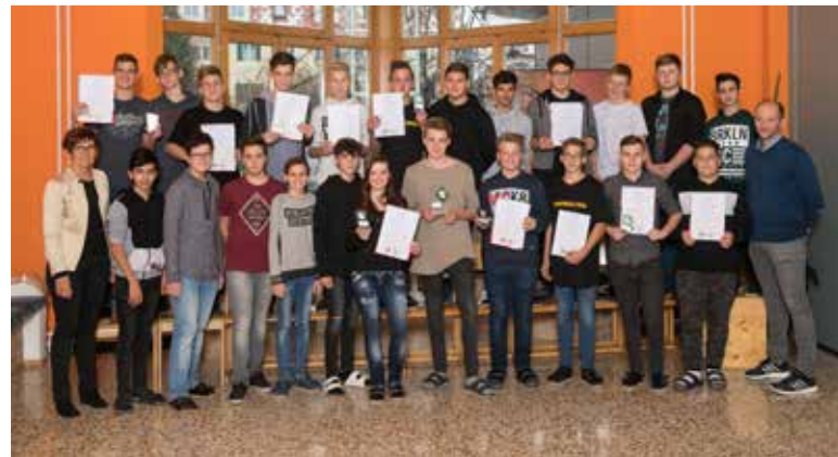
Gruppenfoto der Teilnehmer/innen am Steirischen Baulehrlingscasting