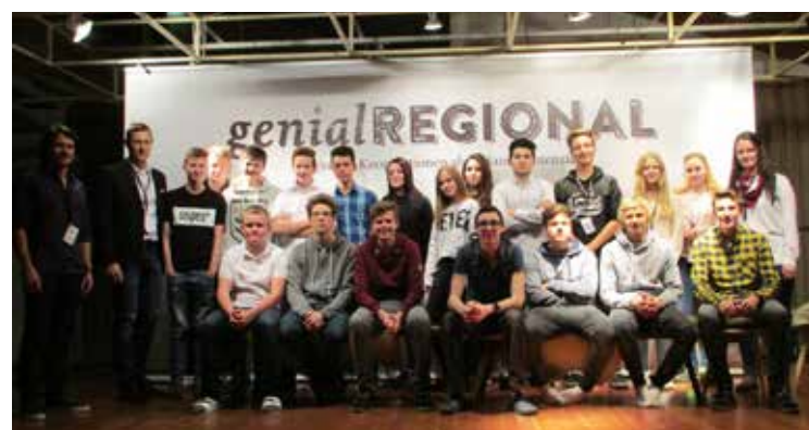
Unsere Schüler/-innen und Lehrer/-innen nach erfolgreich absolvierter Auftaktveranstaltung