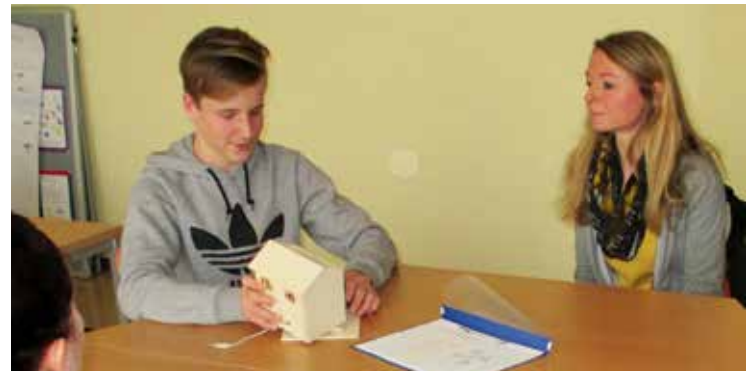
Mutter mit dem Sohn und dem Werkstück (Haus mit Alarmanlage im FB Elektrotechnik) und Lehrerin

Text: Dir. Rosa Högel