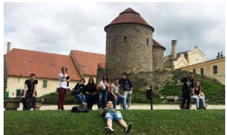
Klasse F4 in Znojmo bei der Rotunde der Hl. Katharina (2017)