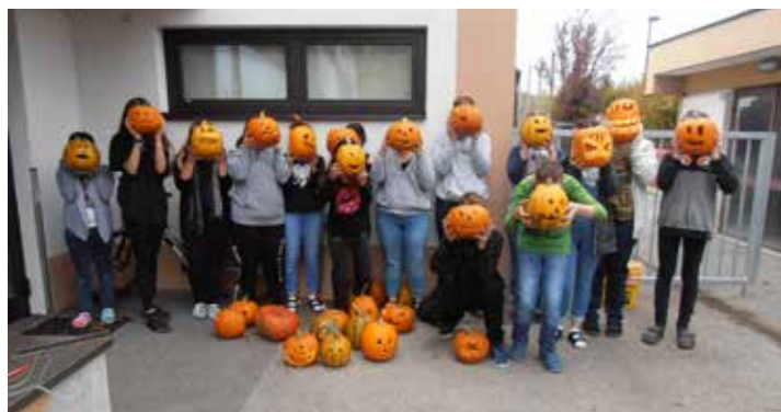
Schülerinnen und Schüler mit den geschnitzten Kürbissen

Text: Angela Schweifer und Foto: Michaela Gräll, PTS Neulengbach – Mitglied von POLYaktiv