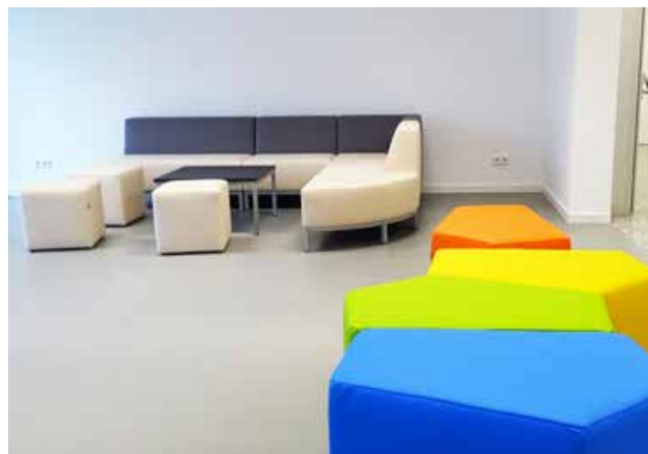
Auf jedem Stockwerk befindet sich eine Chill-Zone mit gemütlichen Sitzgelegenheiten