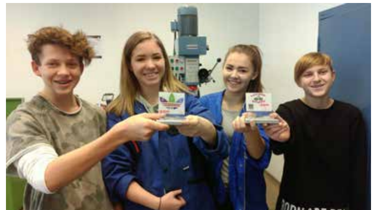
Et voilà: Ein selbstgebauter Handyhalter :-)