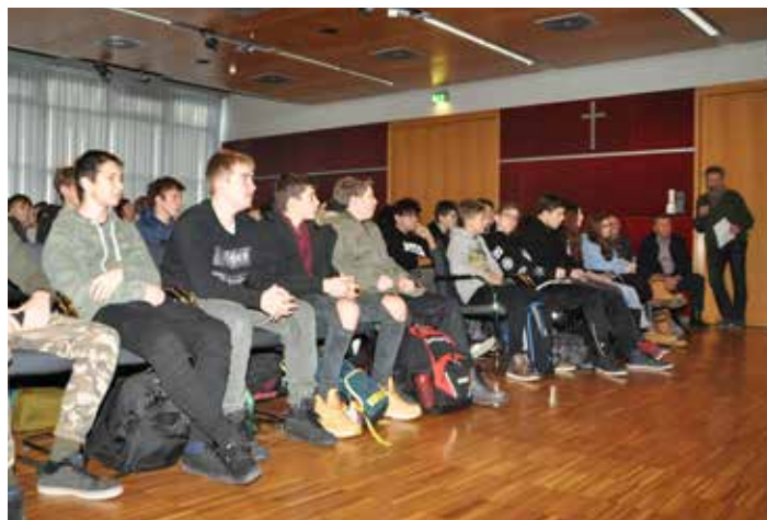
100 Jahre erster Weltkrieg: Mitglieder des Vereins Dorfblick mit den Jugendlichen der PTS Eisenstadt