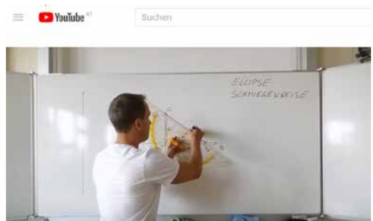
Screenshot vom YouTube Kanal