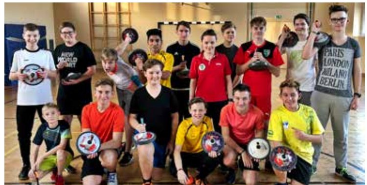
Text: Gabriela Steinscherer

Den Jugendlichen hat das Training sichtlich gefallen – sie warten nur mehr darauf, dass es endlich warm wird und endlich auch auf Asphalt in Deutschfeistritz trainiert werden kann.