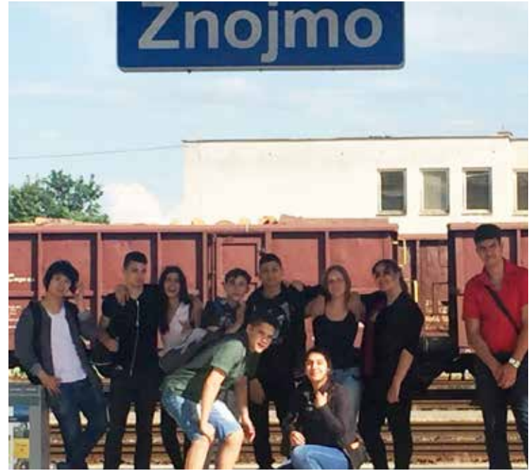
Klasse P2 am Znoimr Bahnhof