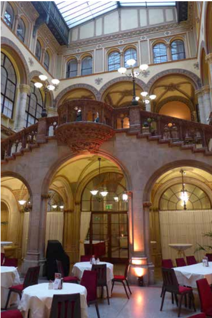
Das Cafe Central als Interviewort