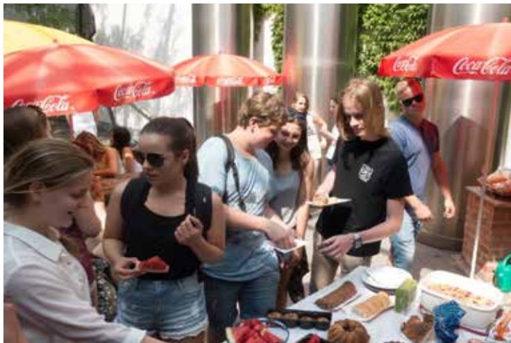
Besuch der Znoimr Klasse in der PTS 20 – Erfrischung im Hof