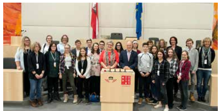
Text PTS Völkermarkt und Fotos ©Parlamentsdirektion/Johannes Zinner POLYaktiv-Förderschule