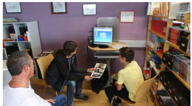
SEL am Ende der Phase 3, Vorstellung der Projektidee: Schüler, Vater, Lehrkraft