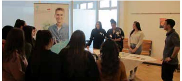
Auch beim Tag der offenen Tür der PTS Urfahr am 29. Jänner stieß der neue Lehrgang „Junge Pflege“ auf reges Interesse der vielen Besucher

Text und Foto: PTS Urfahr POLYaktiv-Förderschule