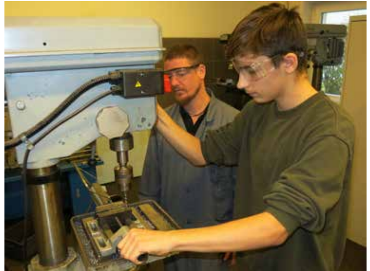
„Praxis lernen“ am Orientierungstag in der PTS Himberg

Text: Juliane Maurer, BEd