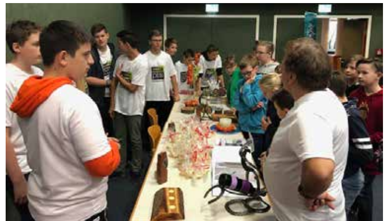
Bilder: Informationsstand der PTS und Stände der regionalen Betriebe