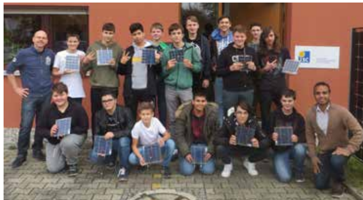
Die Schüler präsentieren die fertigen Module