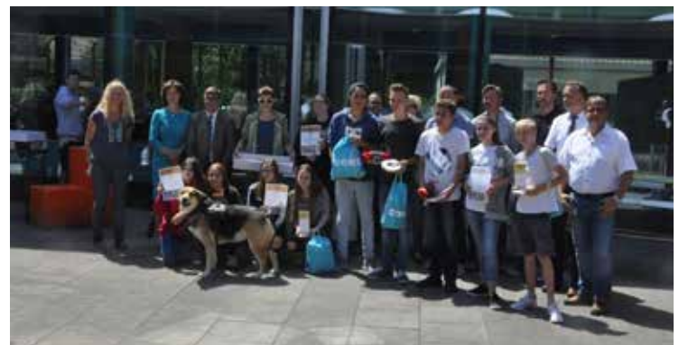
Siegerehrung bei der Vernissage mit unserer Fachjury