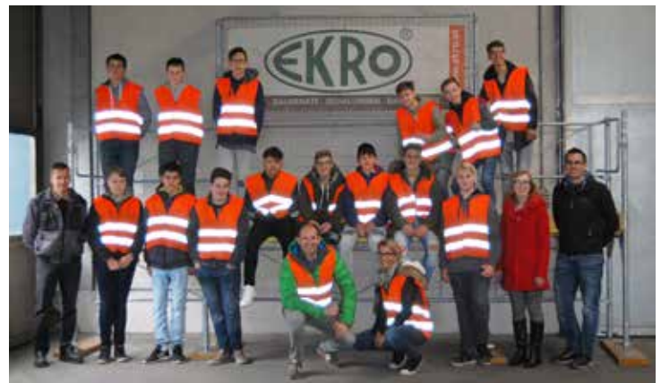
Schüler und Lehrer/innen des Poly Mürz, Begleitpersonen von EKRO

Text und Fotos: PTS Mürzzuschlag POLYaktiv-Förderschule