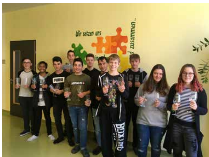
Alle am Projekt teilnehmenden Schülerinnen und Schüler mit ihren selbst gefertigten Gläsern