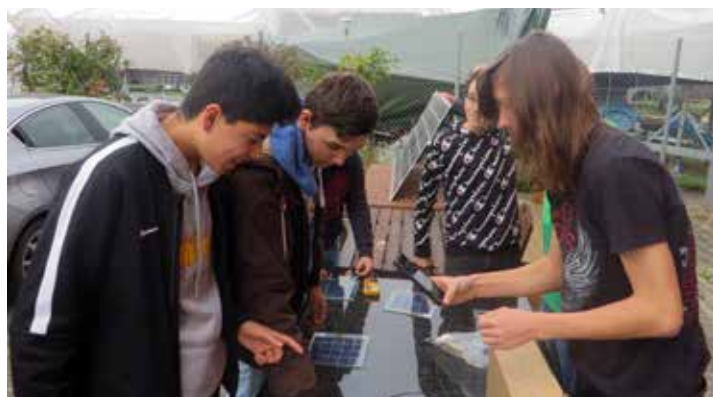
Die Schüler laden ihre Handys mit den Solarmodulen