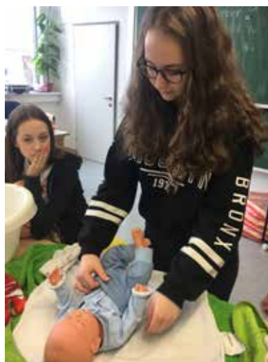
Magdalena beim babyfit-Kurs

Text und Foto: Gisela Kreimer, BEd und Gerlinde Tauber, BEd, PTS Perg POLYaktiv-Förderschule