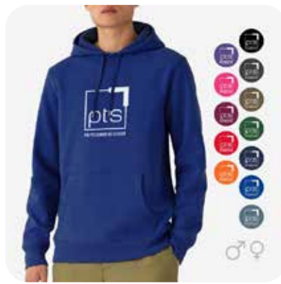
Hoodie PTS Logo groß