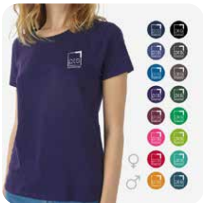
T-Shirt PTS-Logo klein