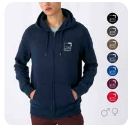
Zipper PTS Logo klein