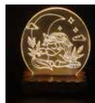
Text und Fotos: PTS Landeck POLYaktiv-Förderschule