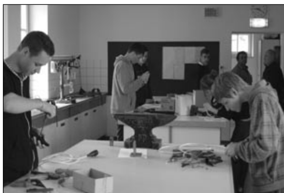
Praktische Arbeit - Anfertigung der Verlängerungsleitung

Besonderer Dank gilt natürlich auch den Sponsoren dieses Wettbewerbs - Fa. Hereschwerke, Fa. Conrad, Fa. SLC sowie der Raiffeisenbank Wildon-Lebring – deren großzügige Unterstützung immer einen wesentlichen Beitrag zum Gelingen einer derartigen Veranstaltung beiträgt.