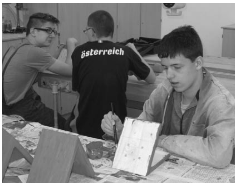
Bericht und Foto: PTS Zistersdorf Mitgliedsschule von POLYAKTIV