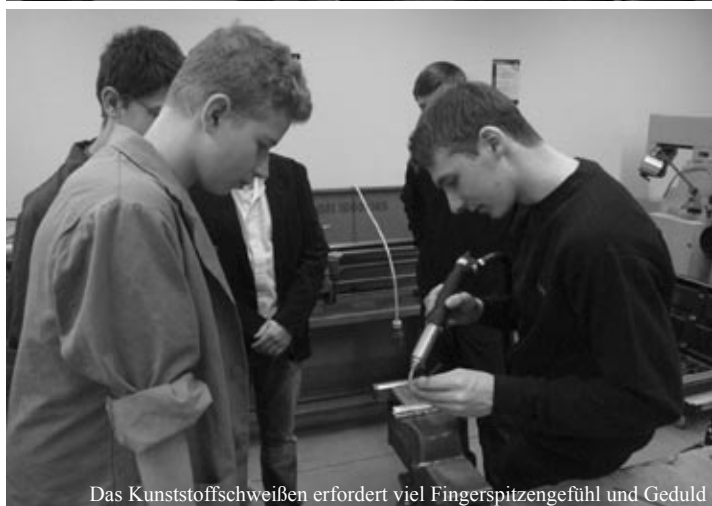
Das Kunststoffschweißen erfordert viel Fingerspitzengefühl und Geduld